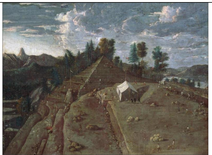
Die Kanderkorrektion, Skizze von Georges Grosjean 1962